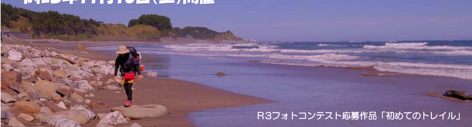
R3フォトコンテスト応募作品「初めてのトレイル」