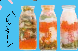
宮古市名物 瓶ドン